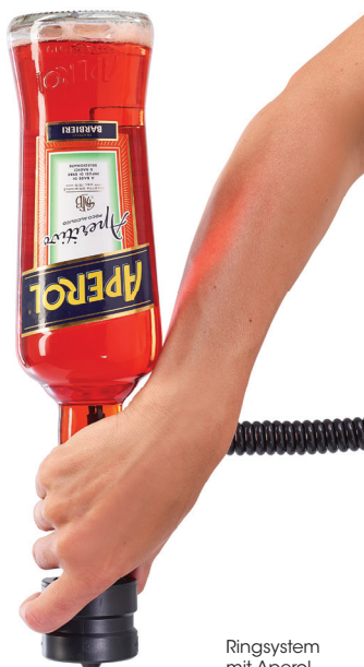
Ringsystem mit Aperol