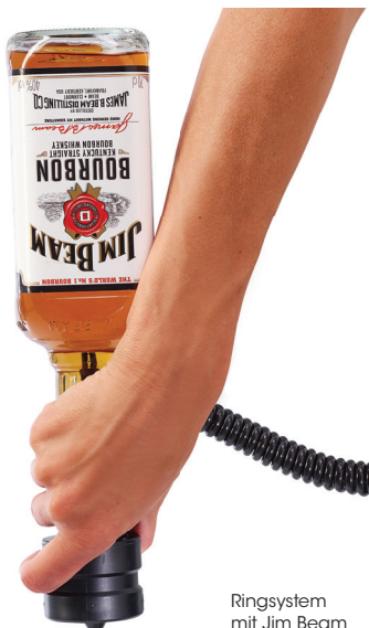
Ringsystem mit Jim Beam