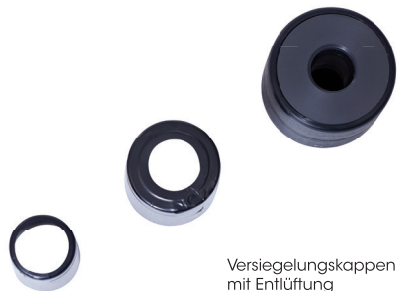
Versiegelungskappen mit Entlüftung